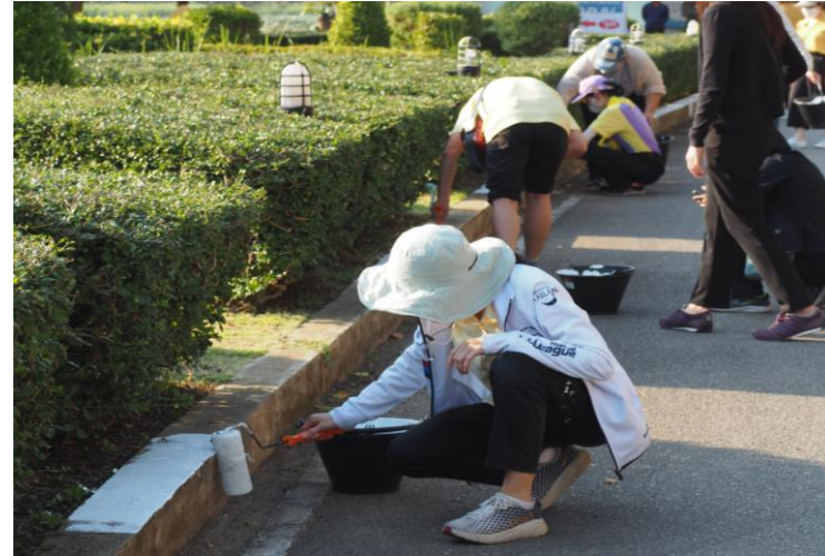
๑.๔ กิจกรรม : จิตอาสา ทำโป่งเทียมสำหรับสัตว์ป่า ณ อุทยานแห่งชาติแก่งกระจาน จ. เพชรบุรี