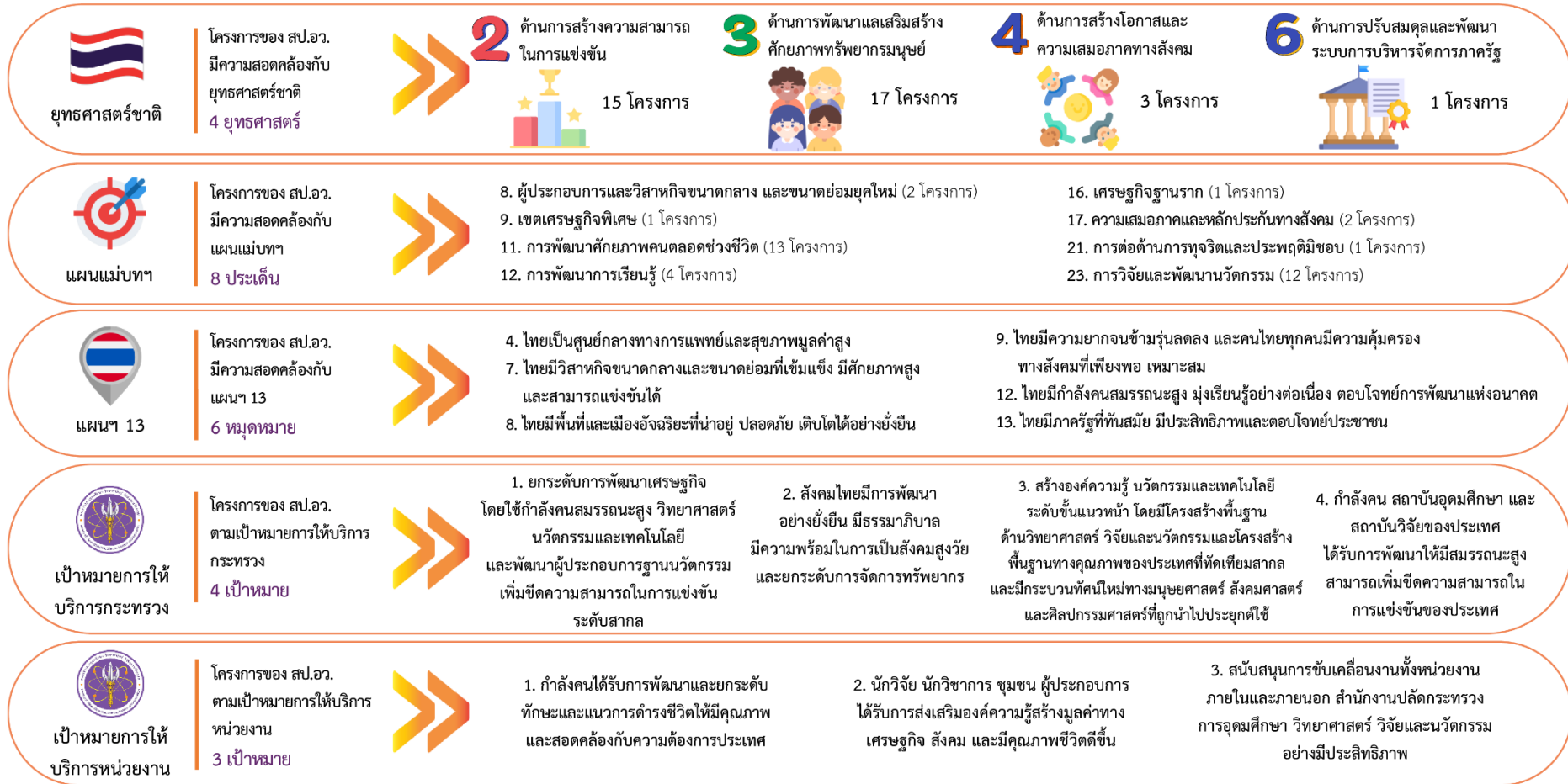
แผนภาพที่ 4.1 ความเชื่อมโยงของแผนงาน/โครงการ ของ สป.อว. ที่สอดคล้องกับแผนระดับต่างๆ ประจำปีงบประมาณ พ.ศ. 2568